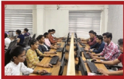
વાઈફાઈથી સજ્જ કમ્પ્યુટર રૂમ